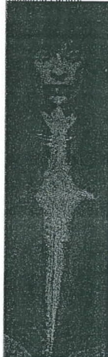
DER BLICK Spiel mit Verführung und Weiblichkeit.

Kaseme Basel 15. November: «Exotic Dreams», Oona Project/ Massimo Furlan