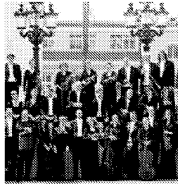
Reisefreudig. Das Kammerorchester Basel.

Das KOB wurzelt in der Serenata Basel, einem Studentenorchester, und hat sich einen Teil dieses alternativen Habitus erhalten. Heute spielt es mit Weltstars wie Cecilia Bartoli, Magdalena Kozena, Angelika Kirchschiager, Andreas Scholl, Giovanni Antonini und Christopher Hogwood und heisst internationale Preise ein – so 2008 einen «Echo»-Preis als bestes Orchester. Seine Aufnahmen der Beethoven-Sinfonien unter Giovanni Antonini bekommen im internationalen Blätterwald glänzende Kritiken.