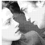
Angebissen. 26,3 Millionen Dollar für «New Moon».

LONDON. In Montreux steht seit 1996 eine überlebensgrosse Freddie-Mercury-Statue am Ufer des Genfer Sees: In England wird diesen Dienstag – 18 Jahre nach dem Tod des Queensängers – das erste Denkmal für den Musiker enthüllt. Ab dem 24. November, Mercurys Sterbetag, wird in dessen Heimatort Feltham in der Nähe von London eine Gedenktafel in Erinnerung an den Popstar zu sehen sein. SDA